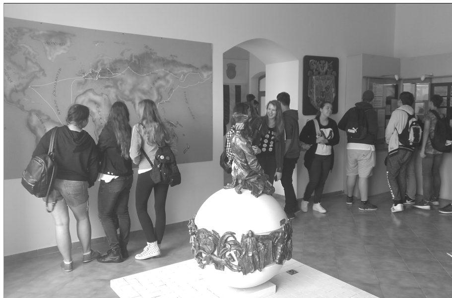
Beňovský do Vrbového stále priťahuje návštevníkov. 7. júna zavítali do jeho rodného domu v rámci školského výletu žiaci z Bratislavy.

Záverom autor vyjadruje nádej, že táto zbierka privedie čitateľov k dosiaľ neznámych informáciám alebo k doplneniu známych údajov a praje všetkým veľa úspechov v ďalších badaniach. Vyjadruje nádej, že nás všetkých publikácia privedie k novým prameňom a inšpiráciám.