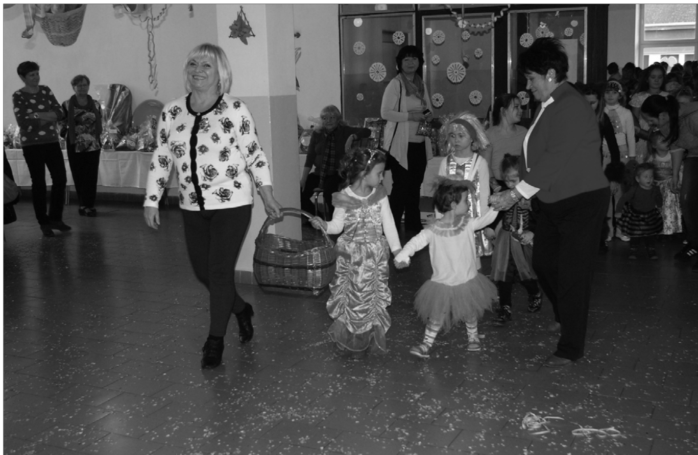
V minulých dňoch vyvrcholili fašiangy v našom meste nielen fašiangovou kapustnicou a koncertovaním skupiny Duo Emi na nádvorí Beňovského kúrie, ale aj ďalšími podujatiami, o ktorých píšeme v Hlase Vrbového. Na snímke záber z detského karnevalu, o ktorom sa viac dočítate na strane 5.