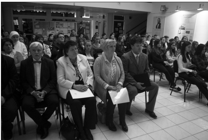
Účastníci kolokvia na gymnáziu