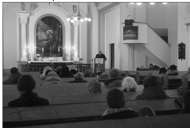
Z programu v evanjelickom kostole