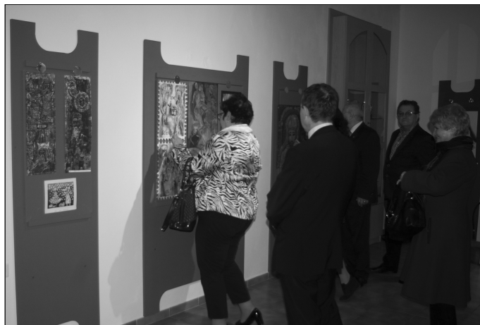
Z otvorenia výstavy