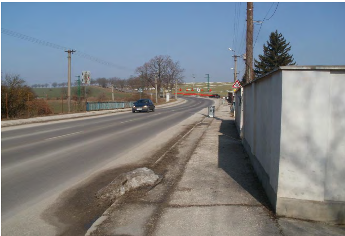
Cesta na Prašník II/499, pravá strana