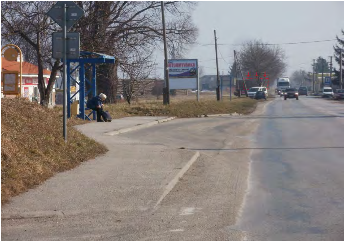
Pieš'anská cesta II/499, lokalita oproti ČS PH, skladová zóna