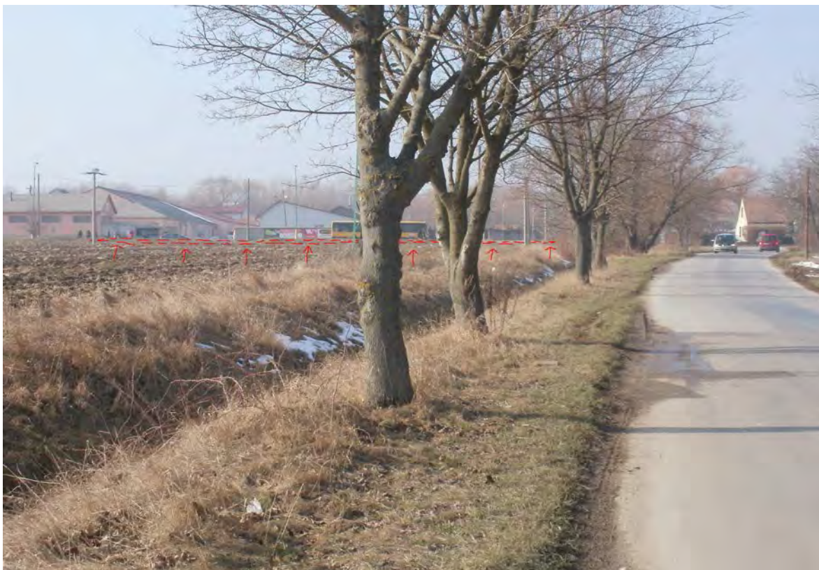
Cesta na Šterusy II/502, lokalita od zástavky PHD ku Družstevnej ul.