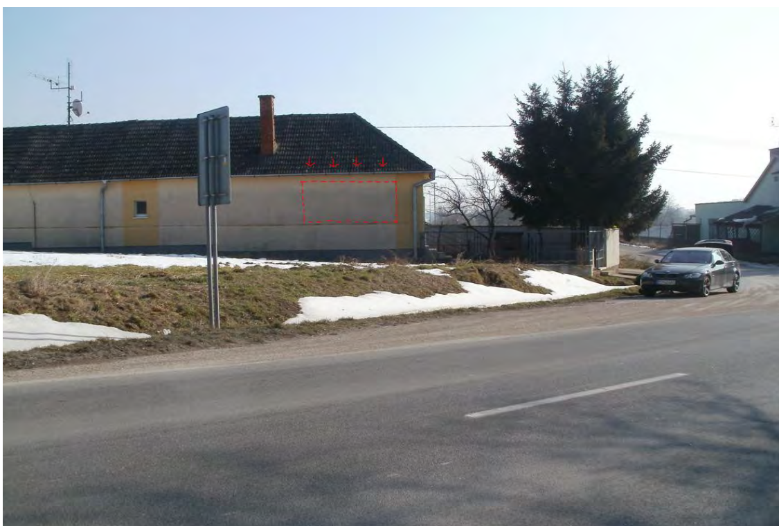
Cesta na Prašník II/499, možnosť umiestnenia na stene domu