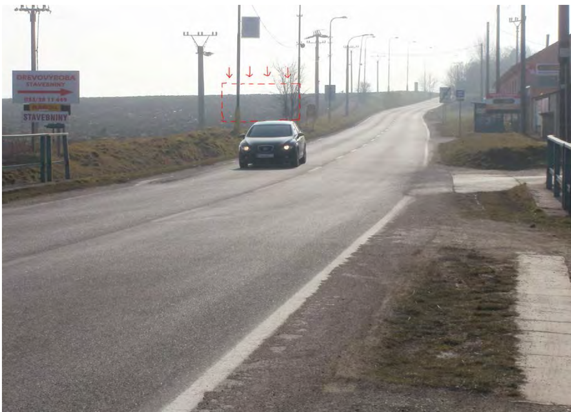
Cesta na Šterusy II/502, lokalita pri zástavke PHD