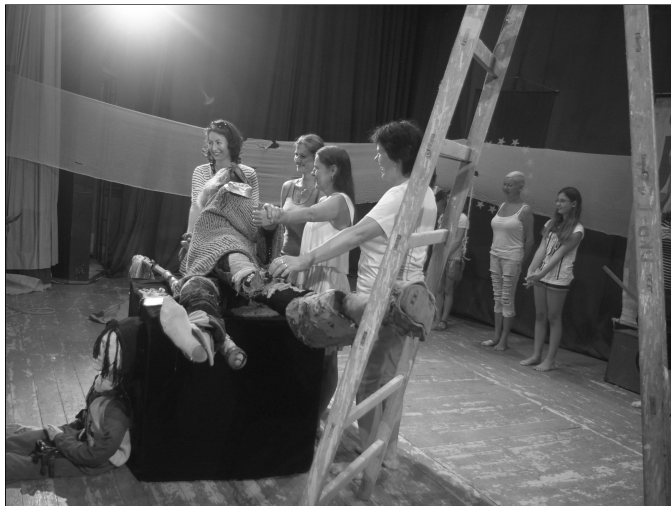
Zábery z komédie Don Quijote de la Ancha , ktorú 27. júla v Dome kultúry vo Vrbovom, predviedli umelci z Brna.