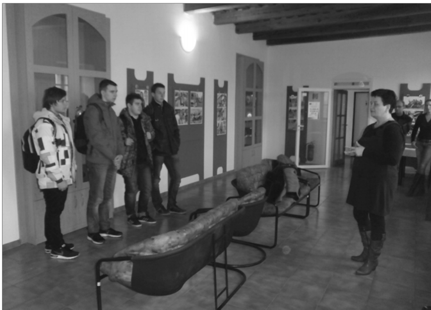
Vedúca oddelenia kultúry Mestského úradu vo Vítkove predstavuje výstavu To som ja - To jsem já - Oto ja.