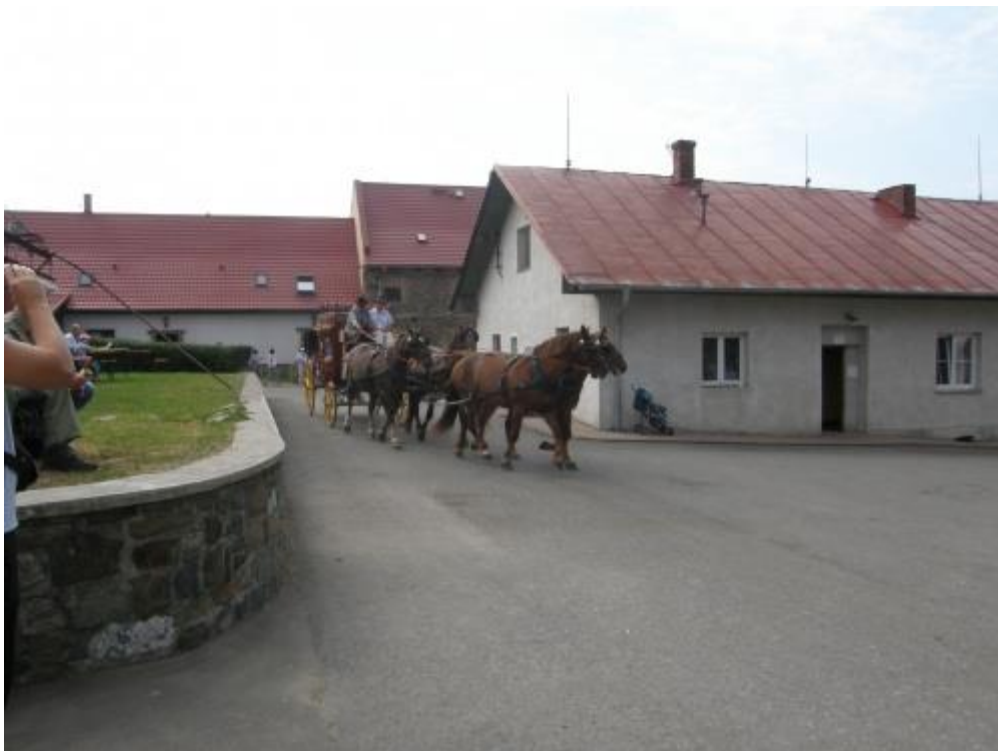
Kočáry přivážející hosty