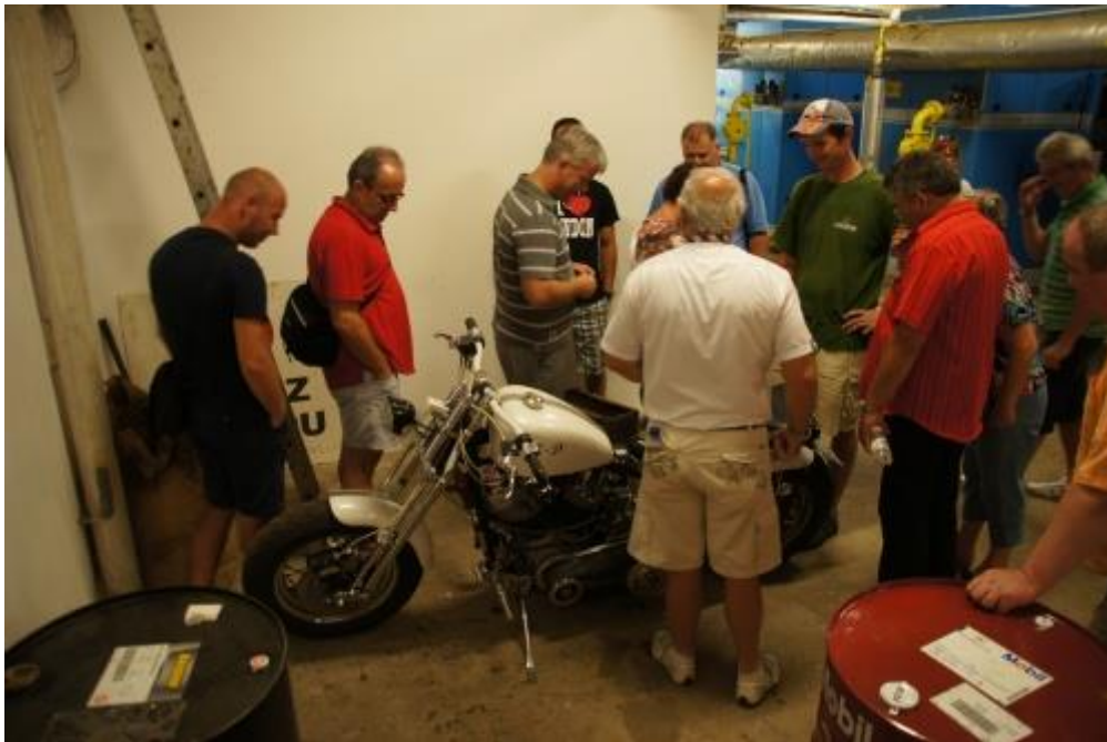
... i tento stroj přilákal pozornost