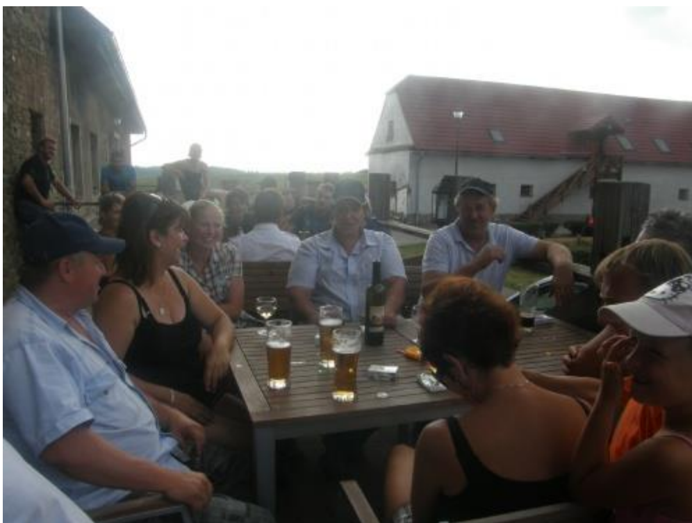
Společné posezení závodníků, chovatelů i laické veřejnosti po skončení závodů.