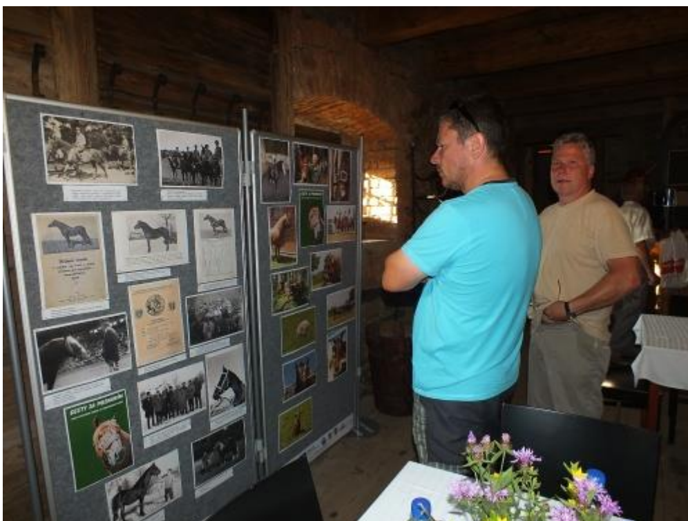
Během celého víkendu si mohli návštěvníci prohlédnout výstavku o chovu koní a slezského norika ve Františkově Dvoře.