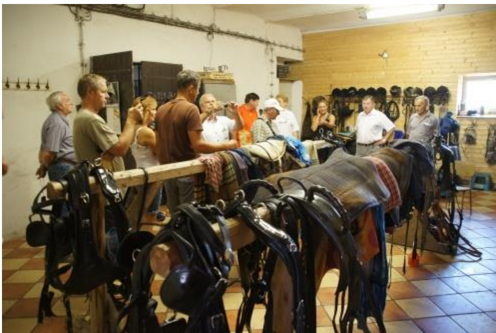
Během prohlídky jsme se dostali také do zázemí. Místo, kde se ukládají a ošetřují sedlářské části výbavy koní (sedla, uzdy, postroje ...).