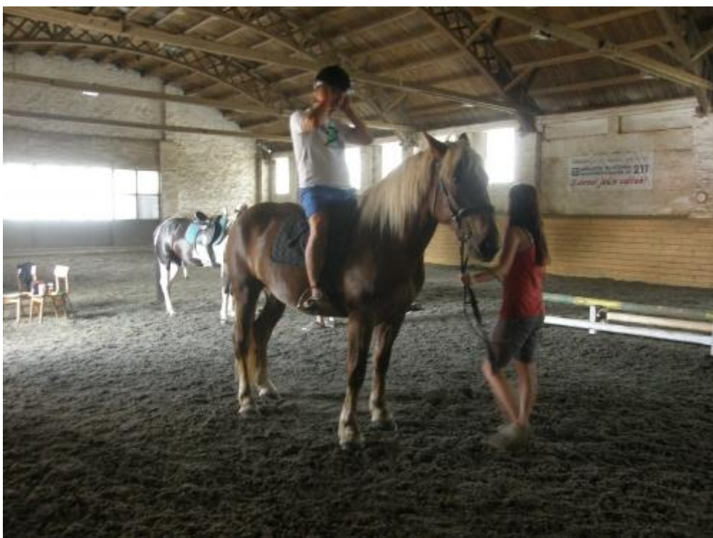
Jízda v sedle