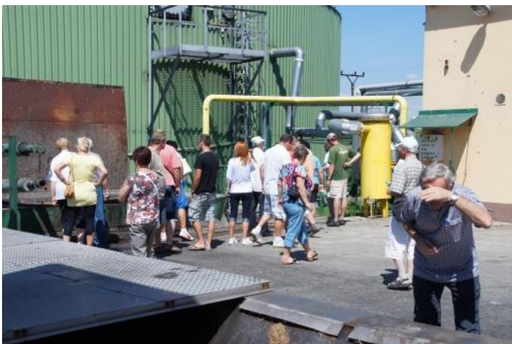
Po prohlídce farmy ve Františkově Dvoře jsme pokračovali prohlídkou bioplynové stanice, která se nachází na okraji obce Klokočov.