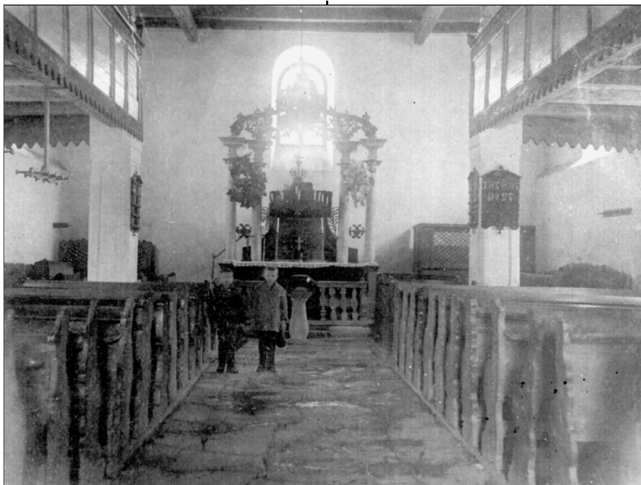
Interiér starého evanjelického tolerančného kostola vo Vrbovom z roku 1784 (zbúraného v roku 1928).