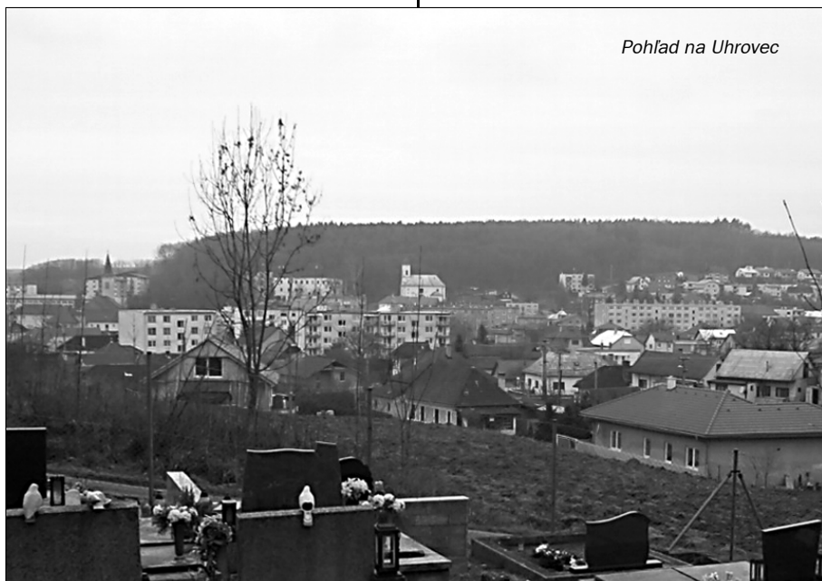
Pohľad na Uhrovec