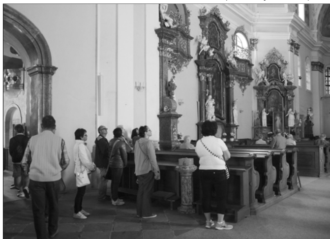
Vo Fulneku Vrbovčania zavítali i do pútnického Chrámu Najsvätejšej Trojice s milostivým obrazom Panny Márie.

Štvrtý - posledný deň bol dňom návratu a tak boli do programu zaradené objekty na trase. Najprv sme navštívili mesto Fulnek, ktorému dominuje zámok na vysokom kopci teraz patriaci súkromníkov. Naše prvé kroky viedli k farskému Kostolu Najsvätejšej Trojice, nádhornej stavbe z konca 18. storočia, ktorá sa pokladá za perlu barokového staviteľstva v regióne a doteraz má pôvodný bohatý barokový inventár a honosnú výzdobu. Po krátkej prechádzke k Čiernej veži, samostatne stojacej zvonice, sme vošli do Pamätníka Jana Amosa Komenského, ktorý pôsobil vo Fulneku v rokoch 1618 - 1621. Fundovaná sprievodkyňa nám poroz-