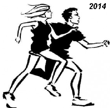
Vrbovská pätnástka Beh zdravia Vrbovčanov

Združenie športových klubov mesta Vrbové – bežecký oddiel pozýva mladých i starších priateľov behu, aktívnych i rekreačných bežcov na aktívnu účasť na Vrbovskej 15 a na Behu zdravia na 5 km dňa 19. júla.