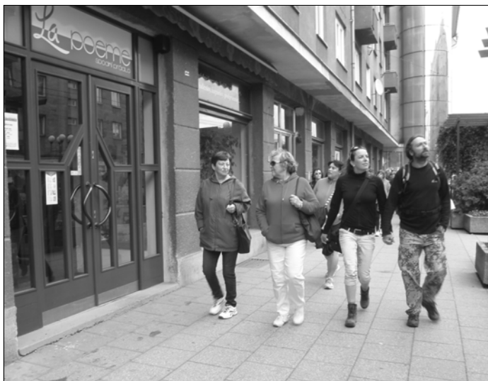
Vrbovčania v uliciach Opavy.

v čase nášho pobytu sa tu konalo niekoľko svadieb. Biely zámok, ktorý majitelia - kniežatá Lichnovskovci - budovali aj ako centrum kultúrneho života, hostil Beethovena, Listu a Paganiniho. Zámok obklopuje nádherný krajinný park.