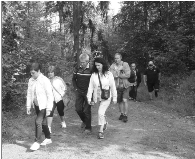
Turistika spestrovala pobyt vo Vítkove.

právava o jeho práci a diele a priblížila nám aj súkromný a rodinný život tohto vedca, pedagóga, teológa a biskupa Jednoty bratskej, nazývaného „učiteľ národov“. V Pamätníku sa nachádza množstvo dokladov o jeho činnosti a časť súkromnej až intímnej korešpondencie.