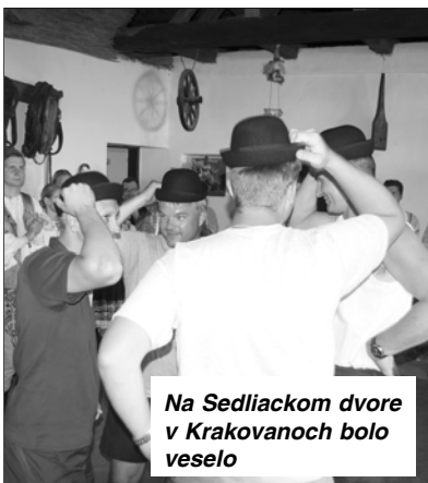
Na Sedliackom dvore v Krakovanoch bolo veselo