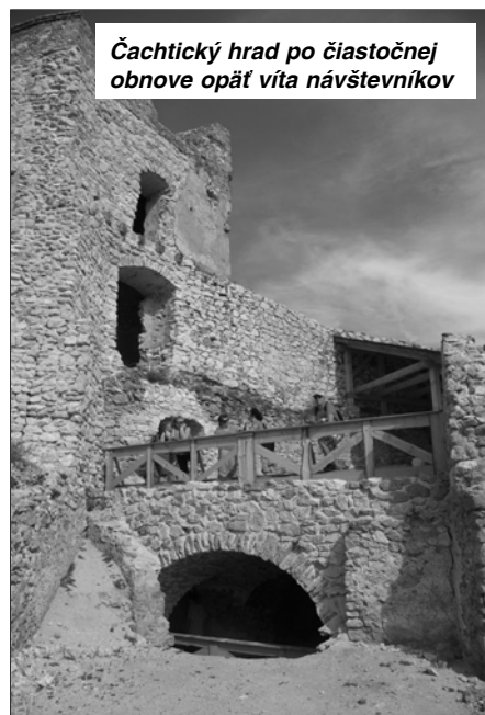
Čachtický hrad po čiastočnej obnove opäť víta návštevníkov

Ďalšou zastávkou bola rekonštruovaná kniežacia mohyla z doby bronzovej v Očkove. Leží hneď oproti očkovskému cintorínu a pre vysoké stromy nie je ju dnes od cesty vidieť. Archeológovia v týchto miestach objavili pohrebiská aj z ďalších predhistorických období a je celkom možné, že očkovský cintorín, vzdialený od dediny, tiež naväzuje na dlhoveké miesta posledného odpočinku. Slnkom rozpálené Čachtice nás privítali na námestí sochou Bátorických v nadživotnej veľkosti. Drevenú plastiku vytvoril ľudový rezbár z Podolia a na námestie je umiestňovaná iba sezónne. Trojkilometrová cesta priamo od nej nás doviedla k Čachtickému