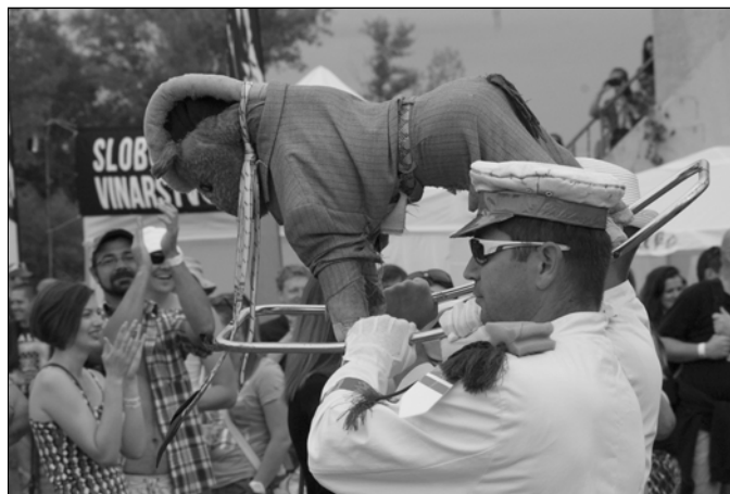
Na festival slávnostne priniesli aj precedu Kiaku Húpacého kona