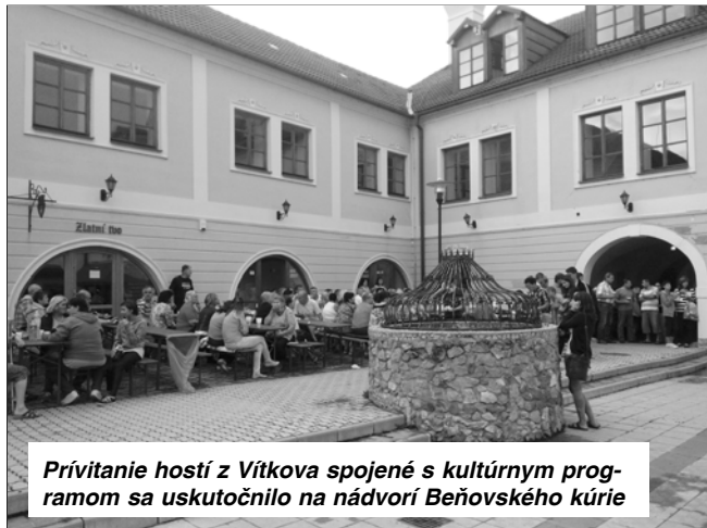
Prívitanie hostí z Vítkova spojené s kultúrnym programom sa uskutočnilo na nádvorí Beňovského kúrie