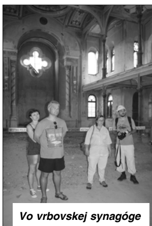
Vo vrbovskej synagóge

Ďalšia zastávka bola vo Vrbovom. Hostom sme ukázali okrem šikmej veže, židovský cintorín (od r. 1994 kultúrna pamiatka), na ktorom je viac ako 1 500 hrobov zomrelých za 250 rokov. Na to nadviazovala prehliadka synagógy, ktorá stále čaká na priaznivejšie časy na svoju obnovu. To bol posledný kontakt našich milých hostí s Vrbovým a odcestovali do Piešťan, kde boli ubytovaní.