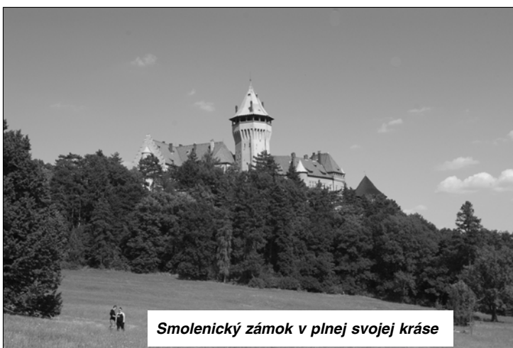
Smolenický zámok v plnej svojej kráse