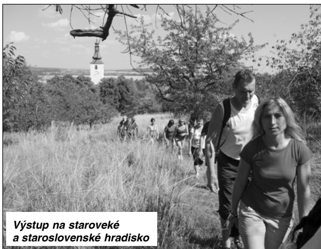
Výstup na staroveké a staroslovenské hradisko