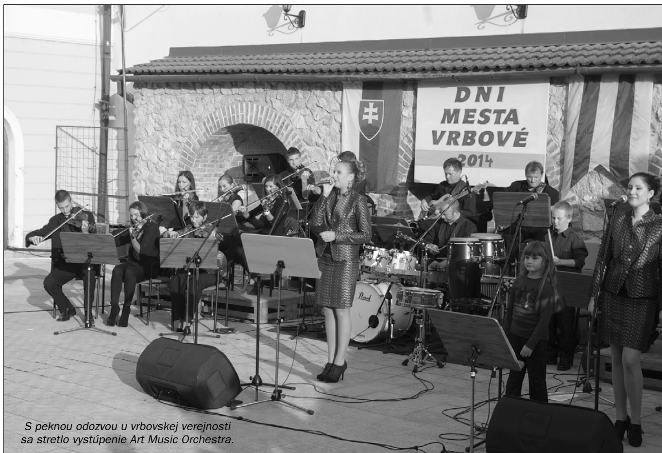
S peknou odozvou u vrbovskej verejnosti sa stretlo vystúpenie Art Music Orchestra.