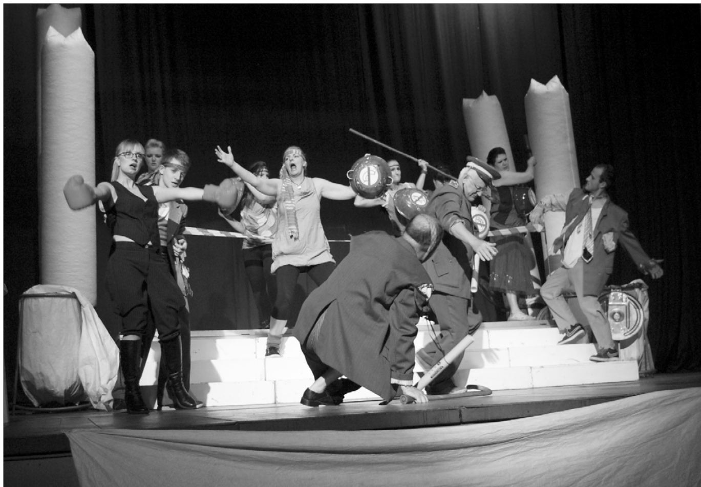
V rámci Dní mesta Vrbové sa u nás predstavilo Záhorácke divadlo zo Senice s hrou Lýsistrata . Viac o podujatí v čísle.

ZO ÚŽS, MS SČK a mesto Vrbové Vás pozývajú na