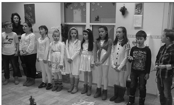
Vystúpenia detí, žiakov I. a II. ZŠ vo Vrbovom.