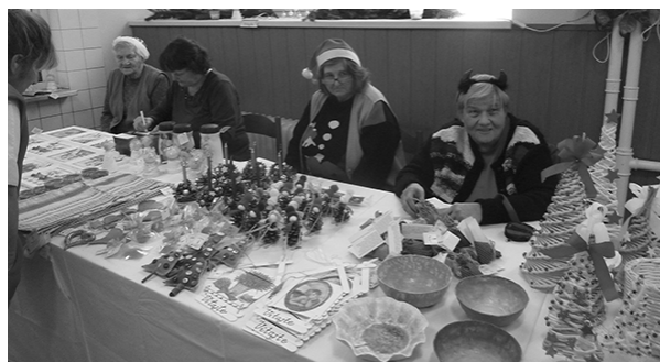
Vianočný trh v Domove Klas.