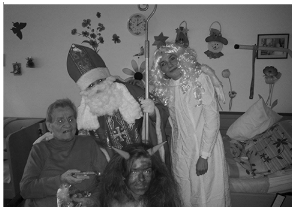
Mikulášska návšteva na izbe domova.