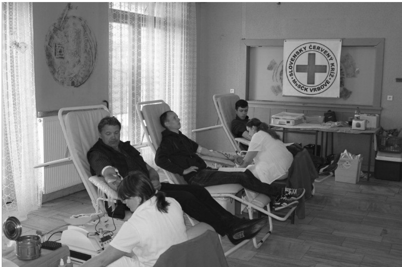
Snímka zachytáva nedávny odber krvi v Dome kultúry vo Vrbovom, ktorý organizoval Miestny spolok Slovenského Červeného kríža vo Vrbovom.