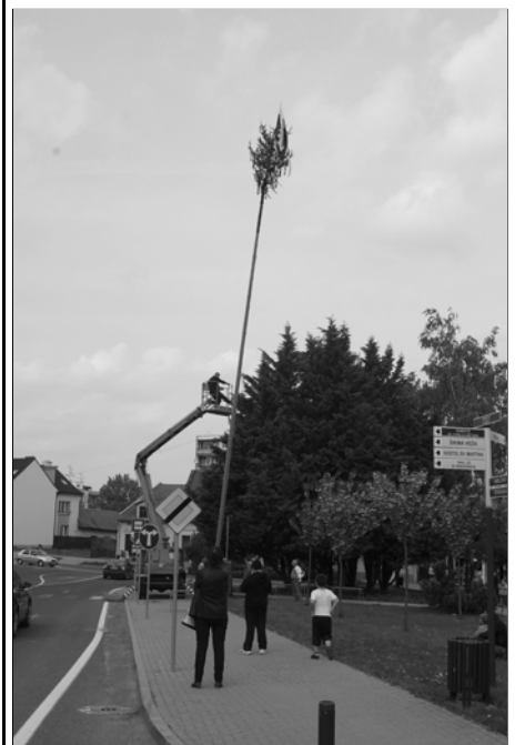
Mesto Vrbové dbá o dodržiavanie ľudových tradícií. Aj tento rok postavilo v centre máj, jeho výška je 22 m a v okrese nemá páru.

Zo zápisnice z rokovania, zapísala E. BELIČKOVÁ