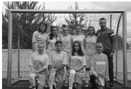
Jednota Futbal Cup - víťazky z I. ZŠ Vrbové