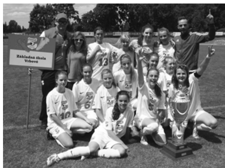
Coca-Cola Cup - víťazky z I. ZŠ Vrbové