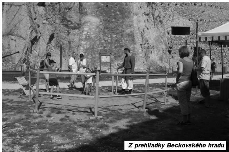
Z prehliadky Beckovského hradu