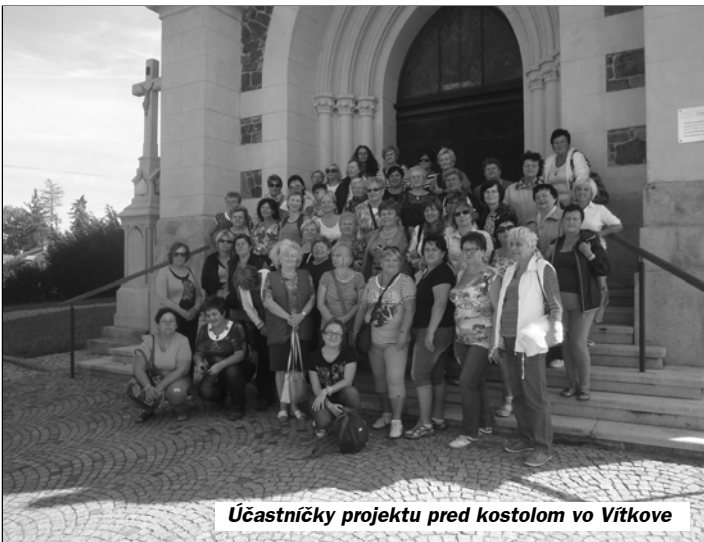
Účastníčky projektu pred kostolom vo Vítkove