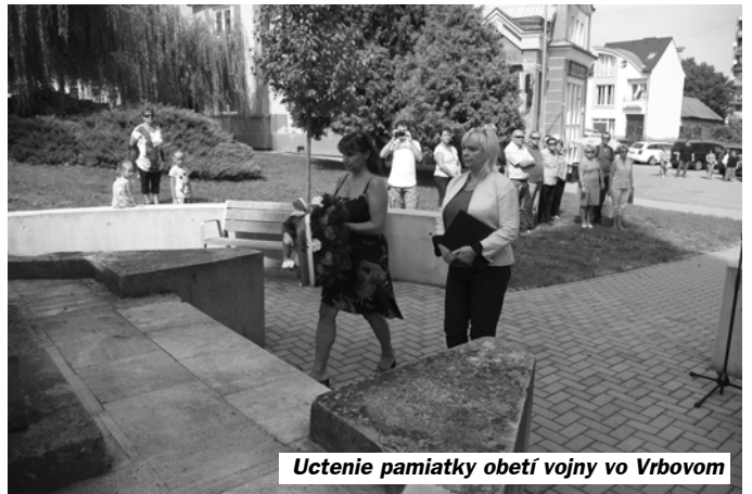
Uctenie pamiatky obetí vojny vo Vrbovom