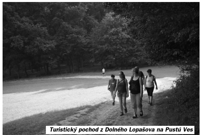
Turistický pochod z Dolného Lopašova na Pustú Ves