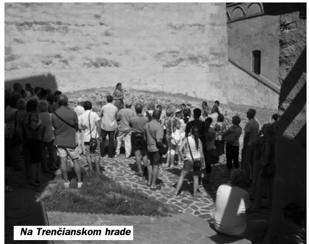
Na Trenčianskom hrade