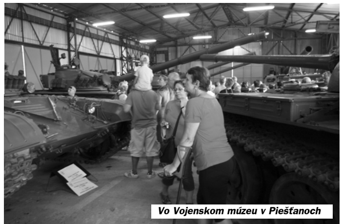
Vo Vojenskom múzeu v Piešťanoch