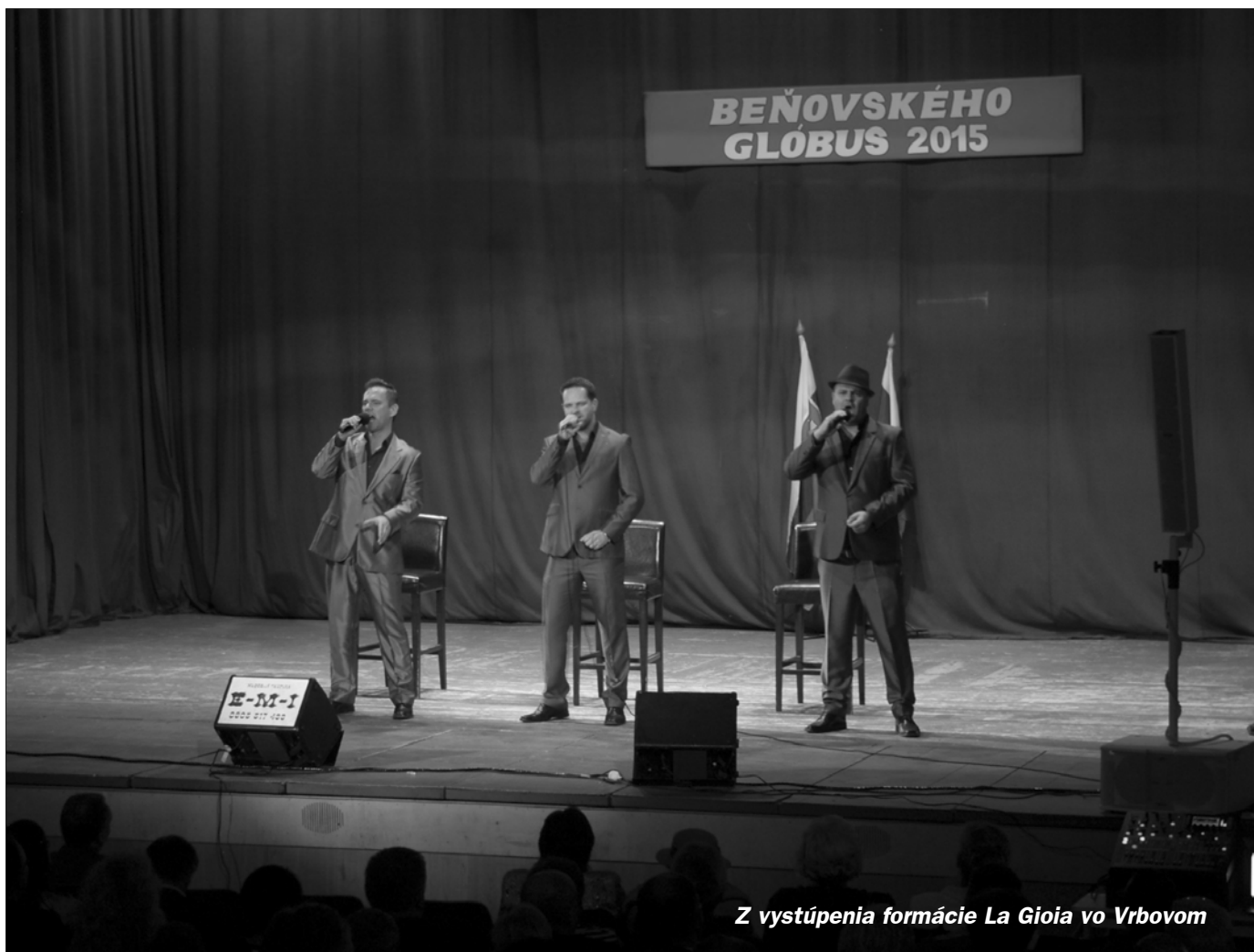
Z vystúpenia formácie La Gioia vo Vrbovom