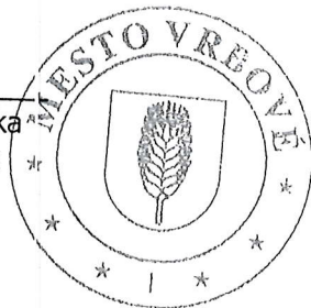
Igor Pečeňadský nájomca